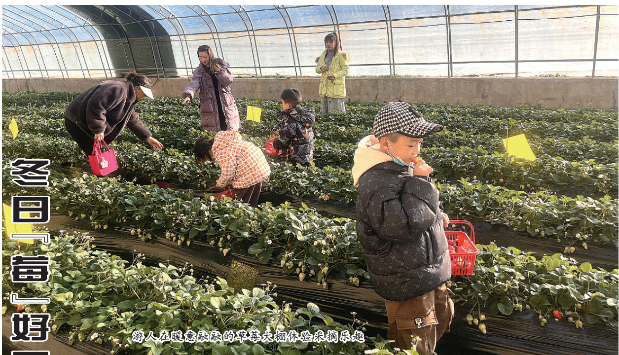
人们在暖室融融的草莓大棚体验采摘乐趣