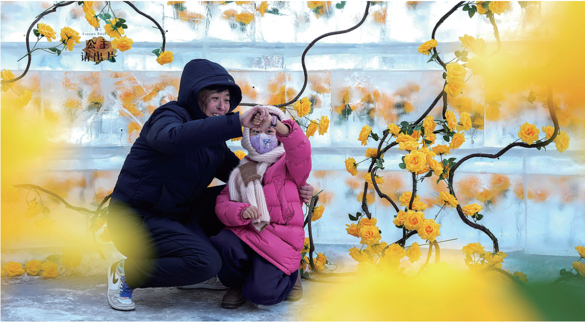
2026年1月3日，游人在哈尔滨哈西万达广场前的“冰玫瑰”景观旁合影。随着第42届中国·哈尔滨国际冰雪节启幕，“冰城”今冬再次“美出圈”。冰雪不仅是刻在当地人骨子里的浪漫，更是这座城市独有的文化名片。这片土地上的人们与冰雪相伴，将寒冬过成了一首浪漫的诗。

商务部副部长盛秋平表示，开展绿色消费是践行绿色低碳发展理念、深入实施提振消费专项行动、加快经济社会全面绿色转型的重要抓手，是顺应消费升级趋势、培育消费新增长点的有力举措，既能推动生产生活方式绿色变革、促进产业结构优化升级，也能助力减少碳排放，实现低碳目标，为“十五五”时期经济社会高质量发展作出贡献。