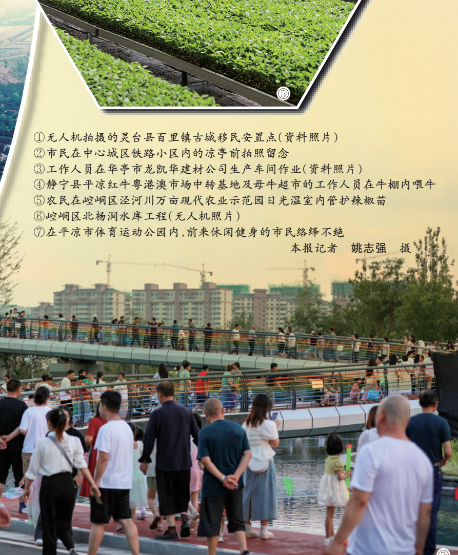
①无人机拍摄的灵台县百里镇古城移民安置点(资料照片) ②市民在中心城区铁路小区内的凉亭前拍照留念 ③工作人员在华亭市龙凯华建材公司生产车间作业(资料照片) ④静宁县平凉红牛粤港澳市场中转基地及母牛超市的工作人员在牛棚内喂牛 ⑤农民在崆峒区泾川万亩现代农业示范园日光温室管护辣椒苗 ⑥崆峒区北杨洞水库工程(无人机照片) ⑦在平凉市体育运动公园内,前来休闲健身的市民络绎不绝