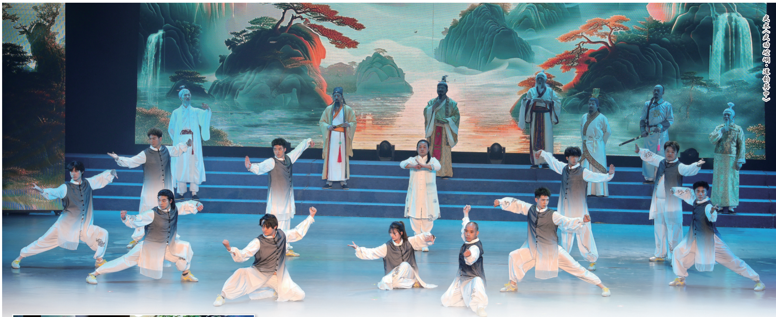
武承·武动崆峒·道韵其节