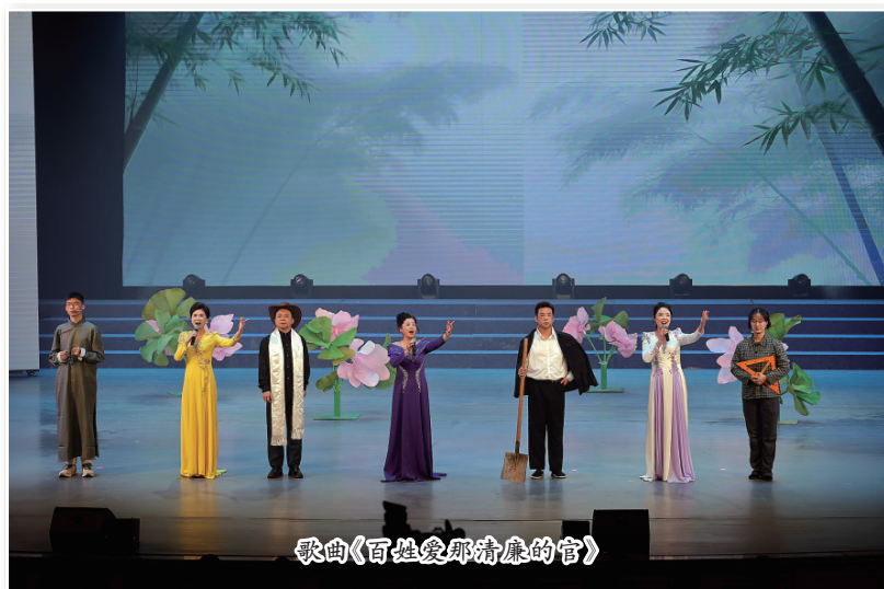
歌曲《百姓爱那清廉的官》