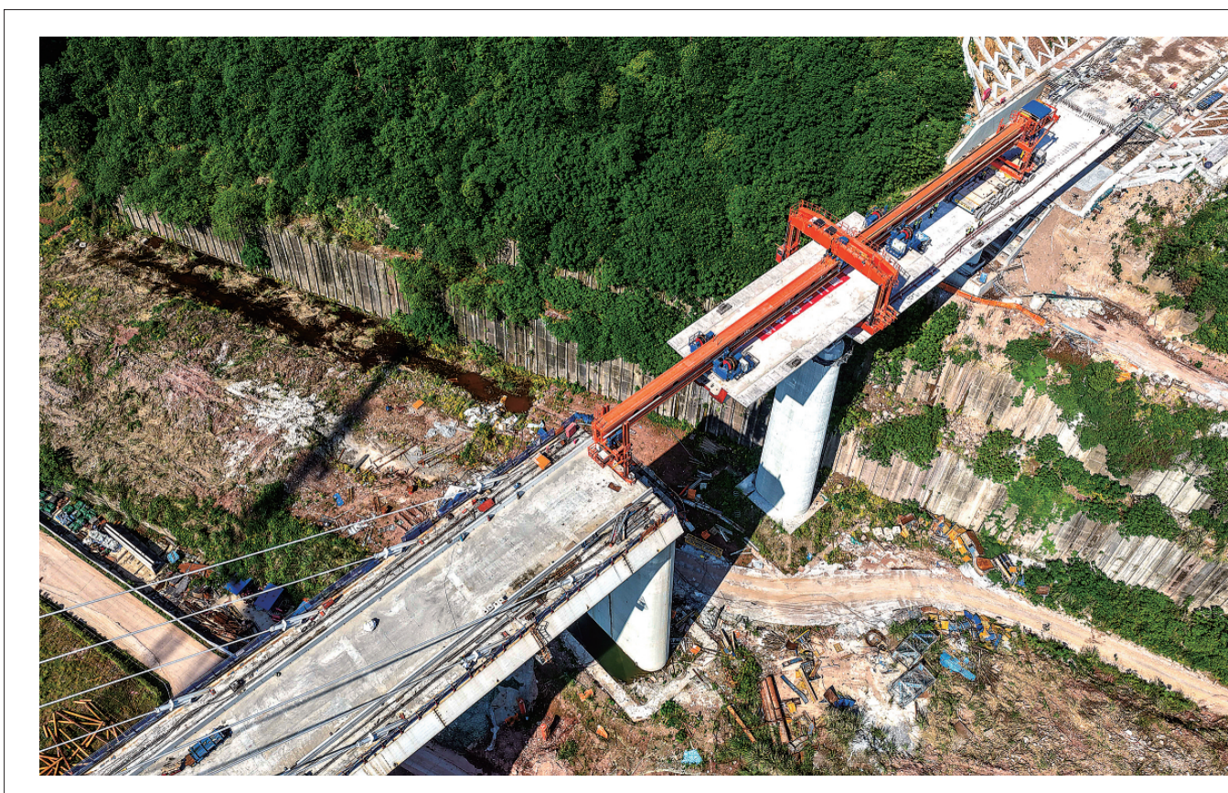
这是5月5日拍摄的成渝中线高铁架梁作业现场(无人机照片)。

同时，举一反三，在全省进一步深入开展安全生产隐患排查大排查、大整治，对重点行业拉网式排查，堵塞漏洞，压实责任，全面提升本质安全水平，守牢守严红线、底线。