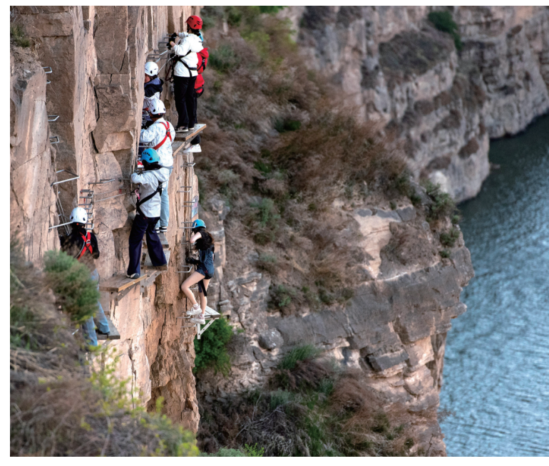
5月3日，游客在内蒙古自治区鄂尔多斯市准格尔旗黄河大峡谷景区体验“飞拉达”攀岩项目。