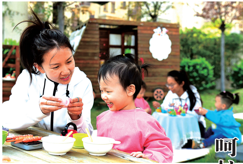
11月6日，在山东省济宁市任兴托幼一体实验园，老师陪托班的小朋友做游戏。 人口大省山东聚焦3岁以下婴幼儿照护需求，积极构建“1+N”普惠托育服务体系，通过发展托育机构、增设幼儿园托班、布局社区嵌入式托育等模式，搭建起多元化的托育服务网络。

各地区各部门要提高政治站位，加强组织领导，认真部署落实元旦、春节期间各项工作，确保本通知精神落到实处。