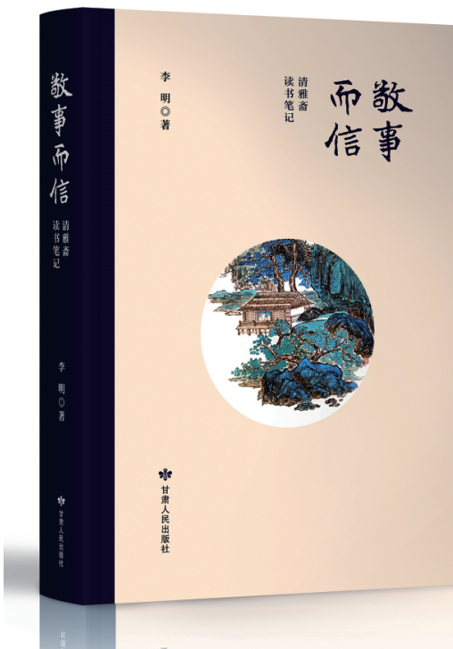
夜深人静时，常有一案书卷，一盏清茶相伴。那些跨越千年的文字从简牍帛间走来，在台灯下与我对话：孔孟的教诲、老庄的道遥、史迁的孤愤、