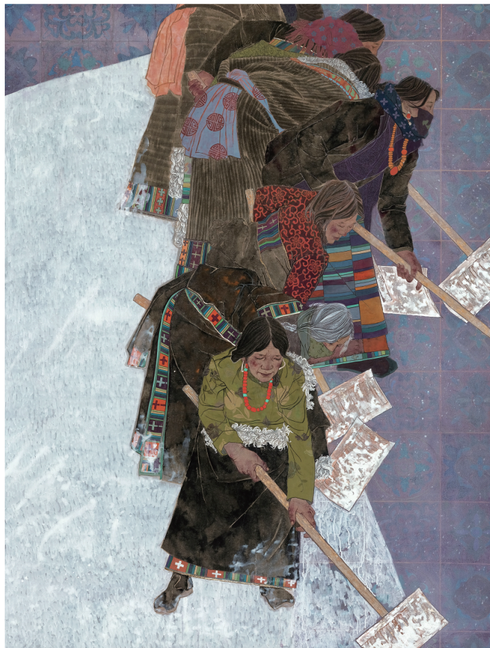
工笔国画（晴日） 李文平 作

书中部分文章曾在省内报刊网络上登载过，受到读者好评。这部书是甘肃人民出版社重点图书之一，该社社长亲自担任责任编辑，印刷精美，图文并茂，可读性强。该书语言平实，引经据典，史料翔实，既有厚重的历史感和很强的现实性，对广大干部群众及不同群体的读者都有所裨益。（陆春潮）