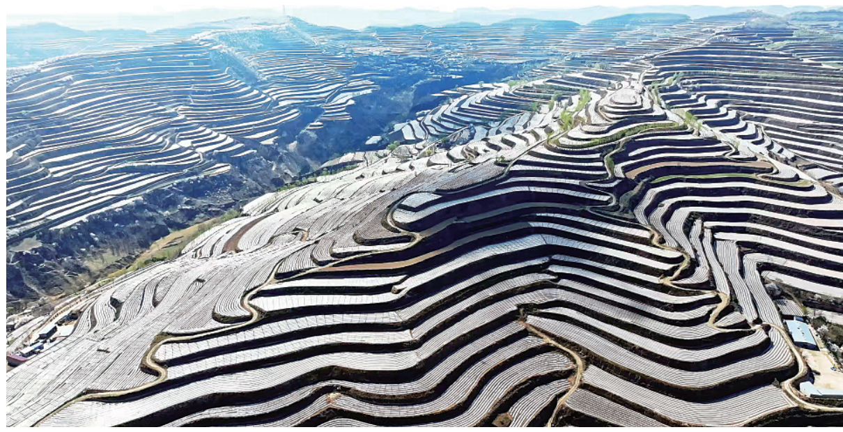
静宁县高标准农田建设三合乡前咀村、古岔村片区(资料图)

平凉地处陇东黄土高原丘陵沟壑区,地形破碎、水土流失、干旱缺水是长期制约农业发展的天然瓶颈。如何让高标准农田建设更贴合实际、更可持续?答案在于精准的规划引领。